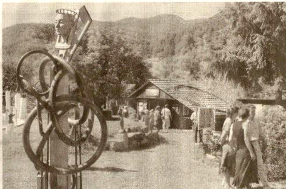
De tous les côtés, sur une vingtaine d'ares, des créations surprenantes.

Dès samedi prochain, à l'occasion de la 6 e édition de "Galerie plein ciel", venus de Chine et du Japon, des deux continents américains mais également de six pays européens et naturellement de l'hexagone, peintres, sculpteurs, récup'arteurs, céramistes, plasticiens... ils seront une cinquantaine à présenter leurs travaux récents; l'art figuratif et quelquefois naïf y côtoie l'abstraction lyrique, les pièces monumentales voisinent avec les petits formats et les miniatures, le fer et le cuivre avec le verre, le dessin subtil et maniéré avec la peinture gestuelle... sans jamais déconcerter le spectateur.